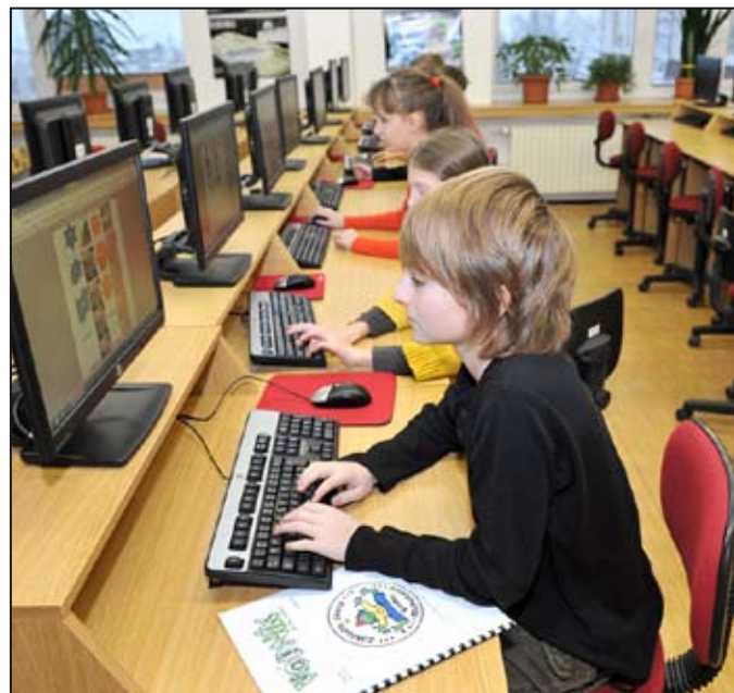
Učebna výpočetní techniky je u žáků velmi oblíbená.