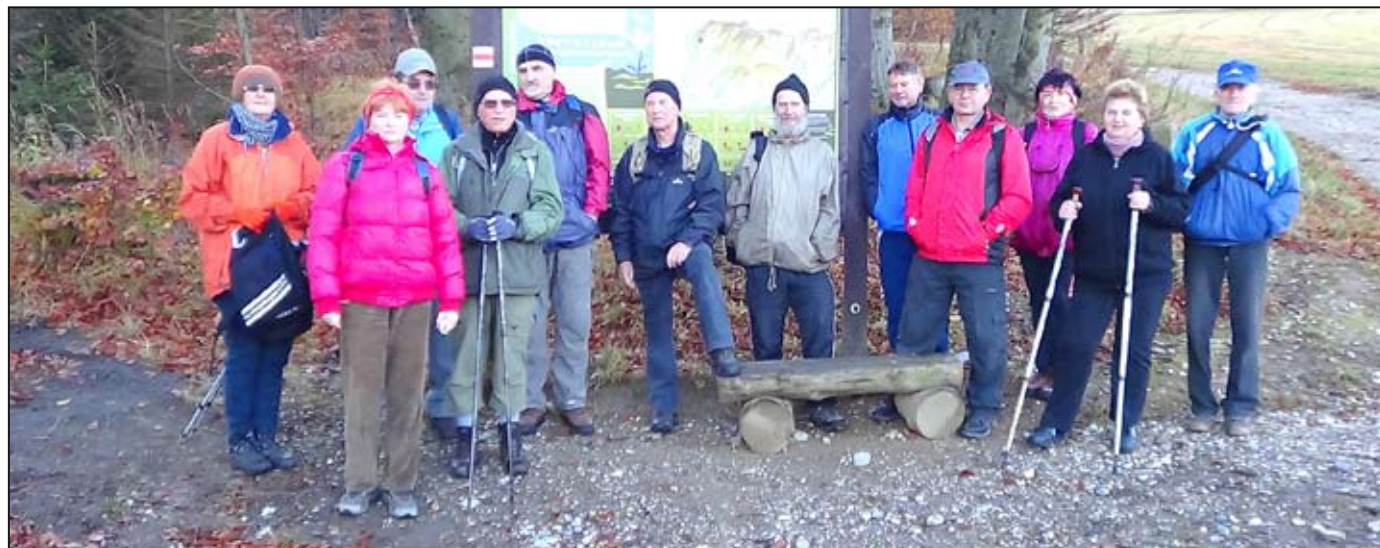
Poslední výšlap v tomto roce