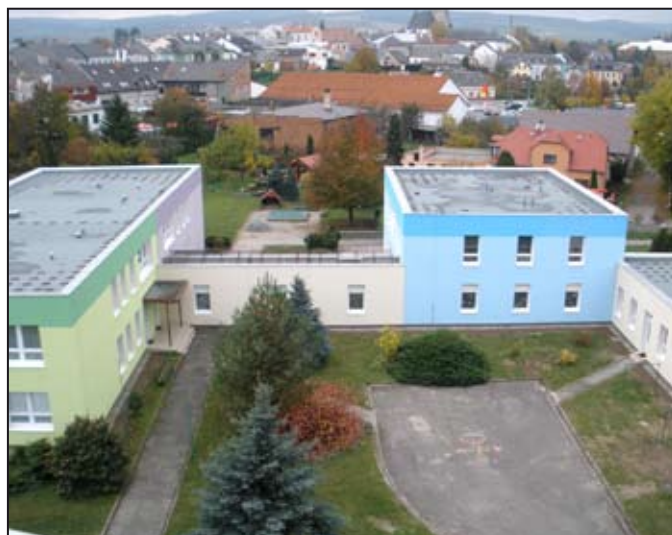
Dětem se barevná školka líbí