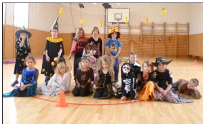
Dětem se přespání ve škole líbilo