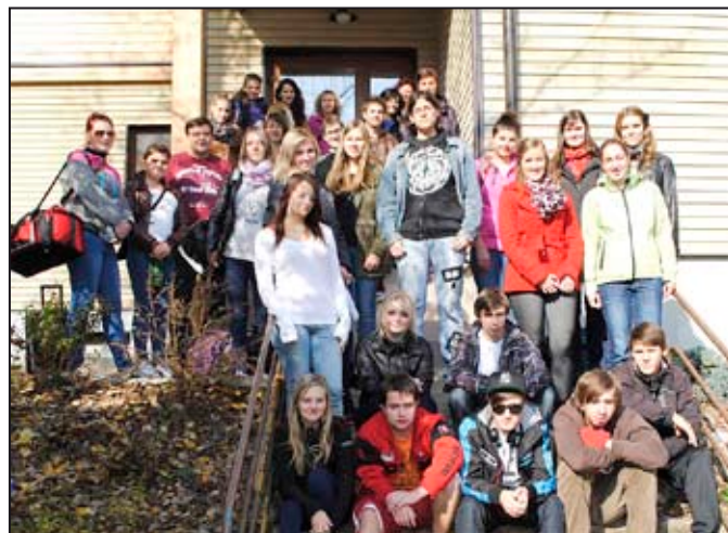
Studenti na kurzu získali nové znalosti.

Letos v srpnu vstoupila Obchodní akademie v Mohelnici do projektu, který je realizován Moravskou vysokou školou Olomouc ve spolupráci s Olomouckým klastrem inovací, odbornou organizací působící v oblasti podpory začínajících podnikatelů. Projekt je zaměřen na rozvoj podnikatelské gramotnosti žáků obchodních akademií. Účastníci se v rámci projektu naučí orientovat se v podnikatelském prostředí zvláště svého regionu, budou schopni rozpoznávat procesy odehrávající se ve firemním sektoru a nakonec budou připraveni se aktivním způsobem zapojit do podnikatelské činnosti. Realizace projektu je postavena na formální i neformální výuce, na tvorbě podnikatelských plánů a na interaktivní spolupráci s významnými mentory z oblasti firemního koučingu.