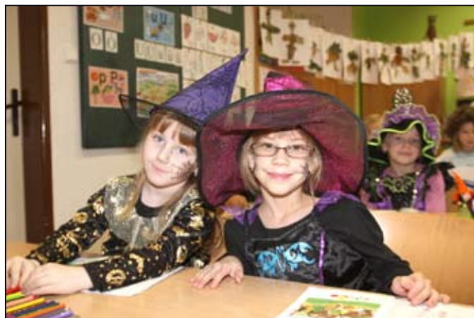
Strašidelný den ve škole