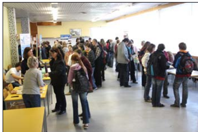
O Malou burzu středních škol byl zájem.

Tato akce si kladla za cíl zprostředkovat žákům a jejich rodičům co největší množství informací o středních školách v okolí a nabídnout bohatou škálu studijních a učebních oborů. Po-