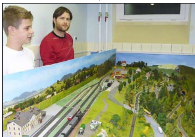
V řídicím středisku

Sobotní železničářský den se vydařil na jedničku. Že je o modelovou železnici mezi veřejností pořád velký zájem, svědčí dvěpadesátka spokojených návštěvníků. Miroslav Škopík